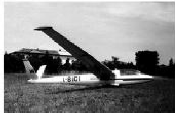
Foto in alto: l'aliante Eolo ® con marche I-BIGI sull'aeroporto di Vergiate.

L'Eolo è stato costruito in un unico esemplare ed è attualmente accantonato presso il Museo dell'Aeronautica Militare di Vigna di Valle.